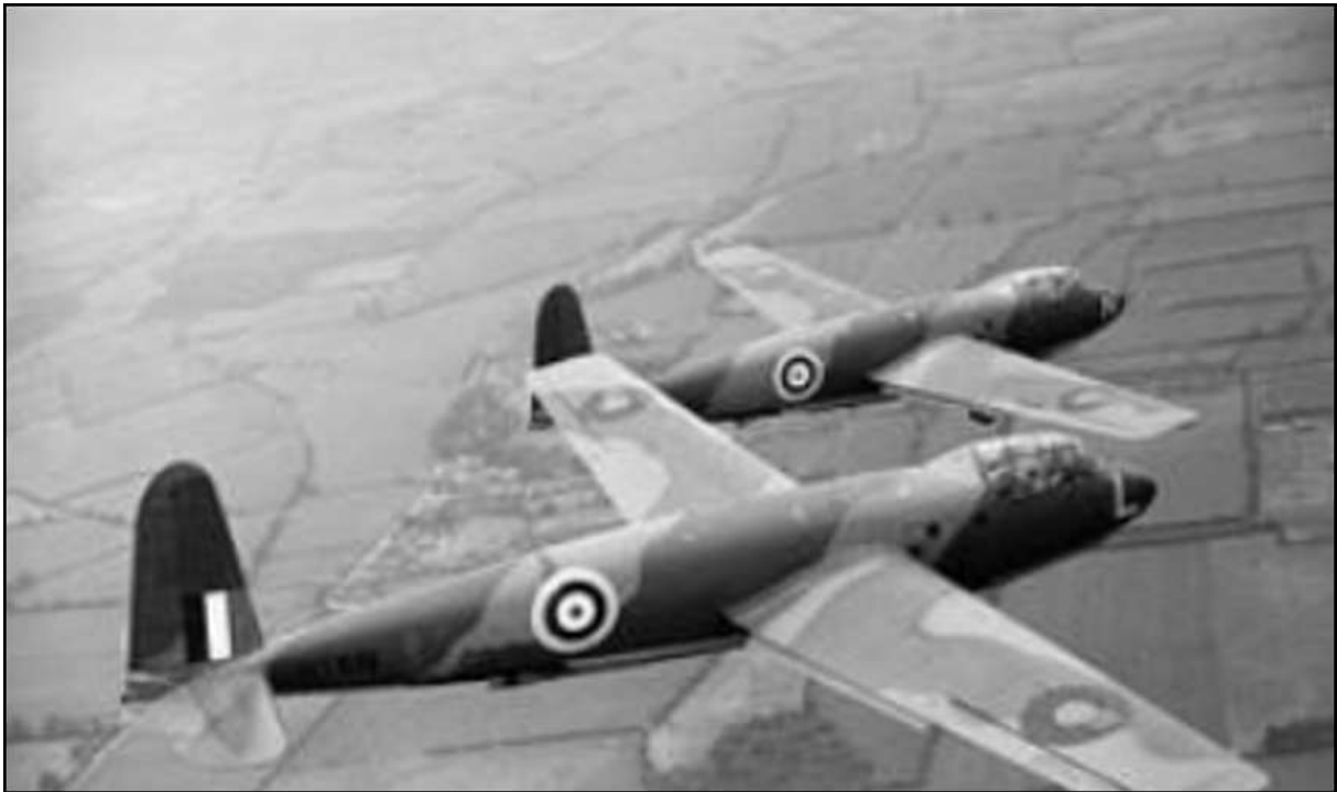
Twee Hotspur Mark II's (BT551 'L' van dichtbij) van de 2nd Glider Training Unit, gestationeerd in Weston-on-the-Green, in vrije vlucht boven het platteland van Oxfordshire, 24 juni 1942. (Two Hotspur Mark IIs (BT551 'L' nearest) of No. 2 Glider Training Unit based at Weston-on-the-Green, in free flight over the Oxfordshire countryside, 24 juni 1942.)