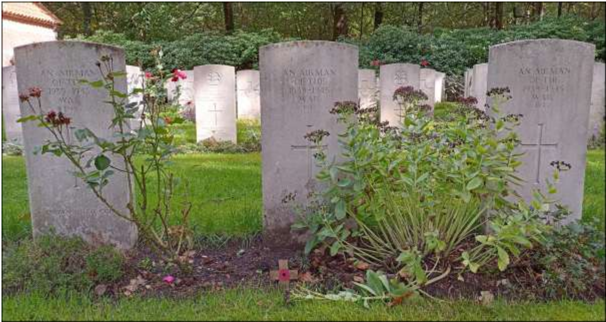
De graven van de drie onbekende airmen op de Overloon War Cemetery, vak IV, rij A. Van links naar rechts het graf 4 met de code X1067, gevolgd door graf 5 met de code X1066A en rechts graf 6 met de code X1066B.