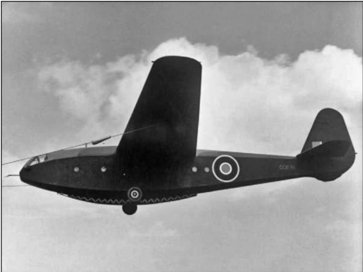
Slingsby T.18 Hengist Mark I, DG676, op sleeptouw tijdens een testvlucht uitgevoerd door de Airborne Forces Experimental Establishment in Sherburn-in-Elmet, Yorkshire, 25 april 1943. (Foto: IWM / MH 5123 / R.S. Punnett Royal Air Force Film Production Unit. Slingsby T.18 Hengist Mark I, DG676, on tow while being tested by the Airborne Forces Experimental Establishment based at Sherburn-in-Elmet, Yorkshire, 25 April 1943.)

De eerste inzet van gliders kwam tijdens Operatie Husky, de geallieerde invasie van Sicilië (9 juli 1943 – 17 augustus 1943). Glider infanterie van de British 1st Airborne Division 1st Airlanding Brigade kregen de opdracht om landingszones landinwaarts te veroveren. Slechte planning en slecht weer waren echter de oorzaak dat de zweefvliegtuigen door de lucht verspreid raakten. Ook moesten verschillende toestellen noodgedwongen op zee landen waarbij 200 man verdronken. Daarnaast raakten tientallen zweefvliegtuigen en sleepvliegtuigen beschadigd of werden zelfs neergeschoten door eigen vuur.