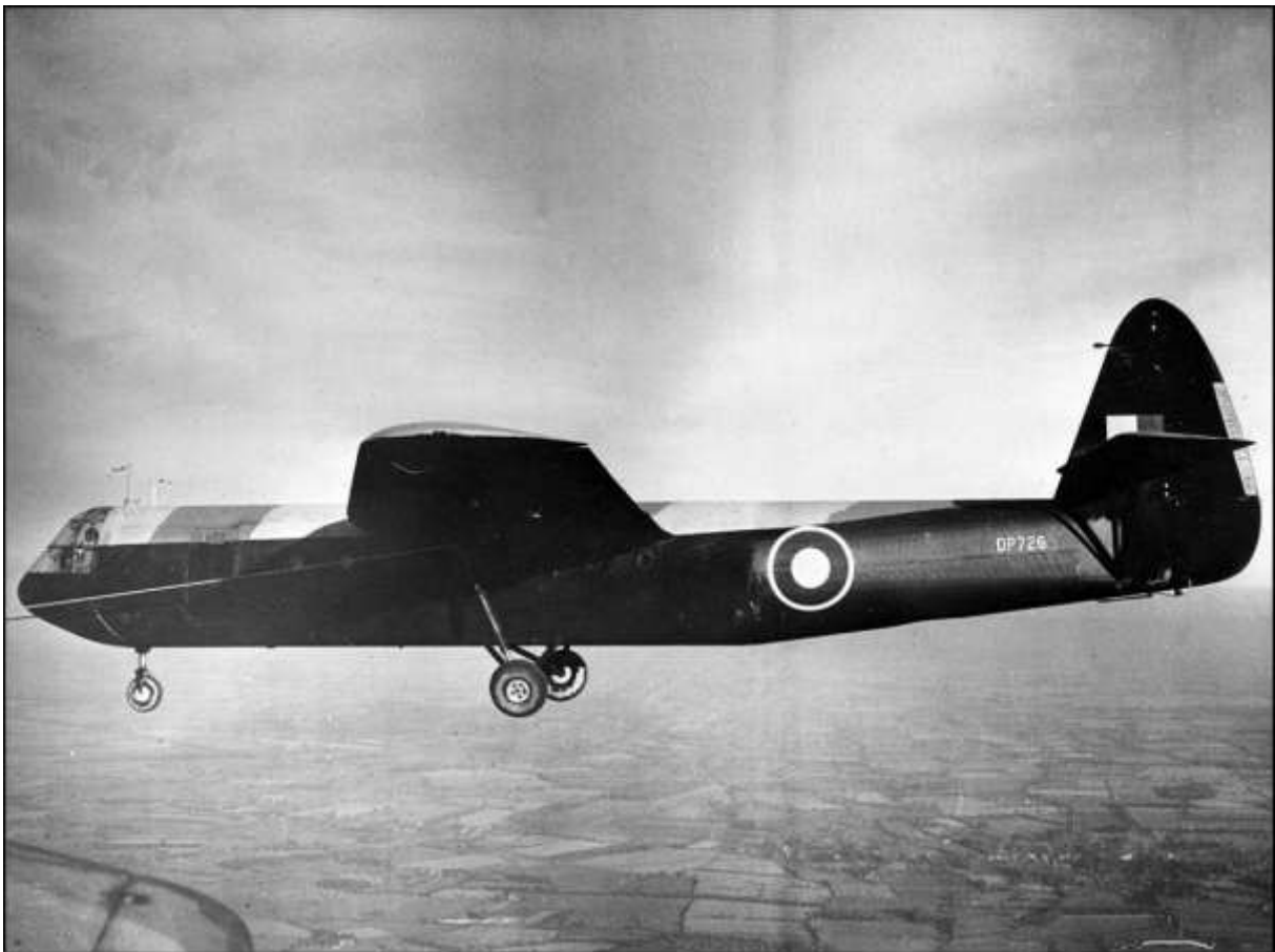
Airspeed Horsa