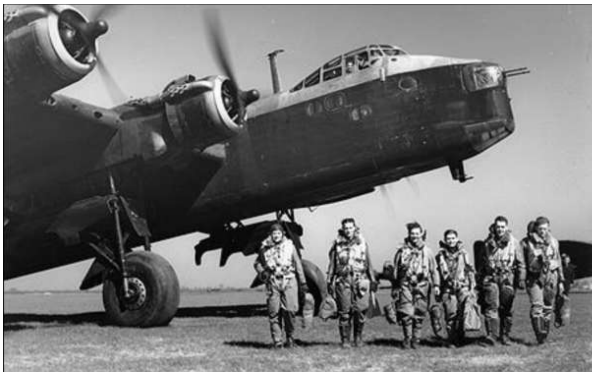
Een eerdere foto van de Short Stirling III BK718 WP-M met de toenmalige bemanning. Het toestel dat neergehaald werd tijdens hun missie boven Duitsland op 4 juli 1944.