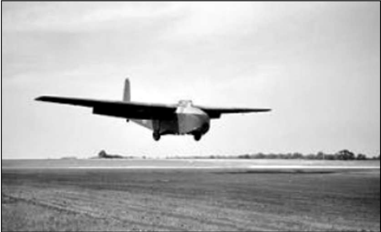
General Aircraft Hamilcar Mk. I, mei 1944. (Foto: IWM / CH 018849 / Royal Air Force official photographer. General Aircraft \Hamilcar Mk. I.)