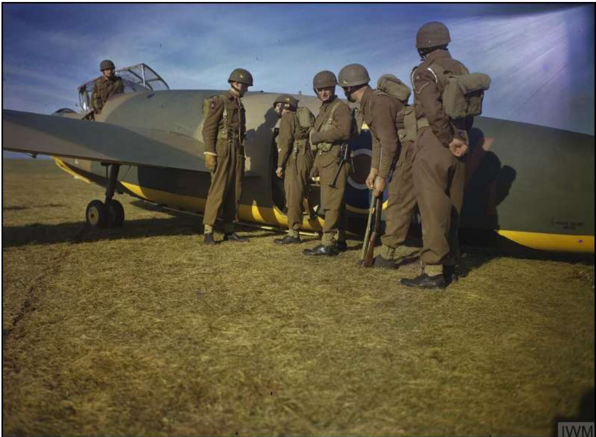
Parachutistentraining met een Hotspur op Netheravon Airfield, Wiltshire, november 1942.